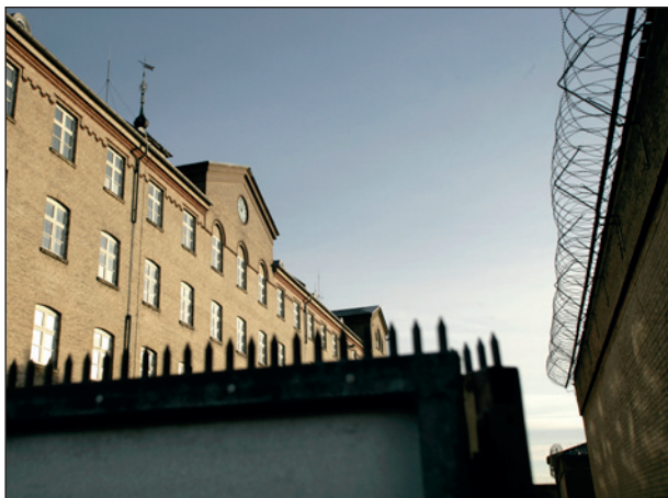
Besøg på FÆNGSLET i Horsens.