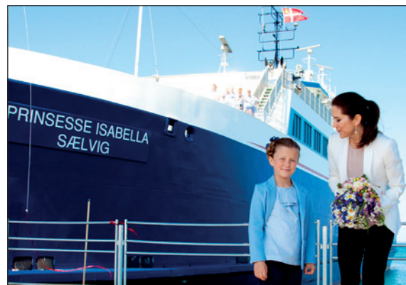
Samsøs nye kommunale rederi er et eksempel på, at en kommunal virksomhed kan spare borgerne penge. Færger blev indviet d. 6. juni 2015 af Kronprinsesse Mary og Prinsesse Isabella.

Midttransport har vundet to udbud og skal derfor fortsat udføre begge sine to opgaver. Den ene er godstrans-