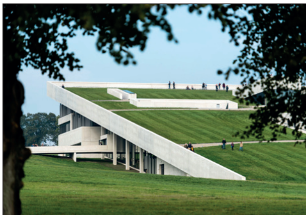
Besøg på Moesgård Museum med spisning d. 13. april.

Vi mødes kl. 15.00 og der er spisning kl. 18.00 Pris 275 kr. pr. person, som indbetales til konto 1551 3656512571. Husk at skrive navn i bankoverførslen. Tilmelding er først gældende, når der er sendt en mail med navn, telefonnr., og cpr.nr. til momsemor1@stofanet.dk og når pengene er betalt.